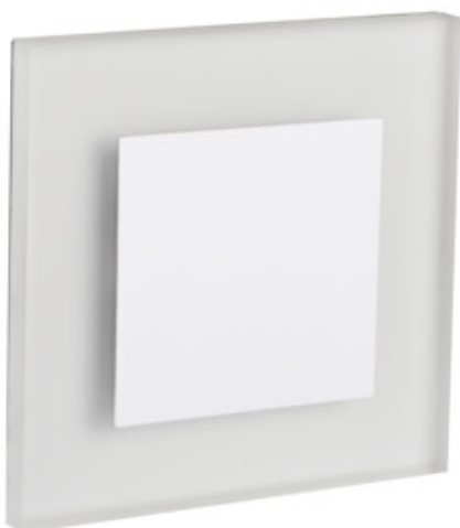
APUS LED AC