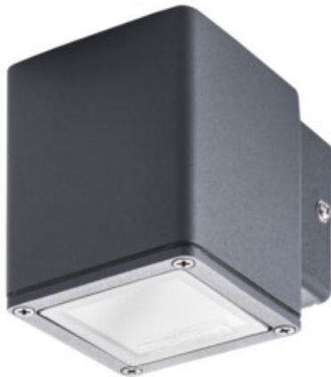
GORI EL 135 D