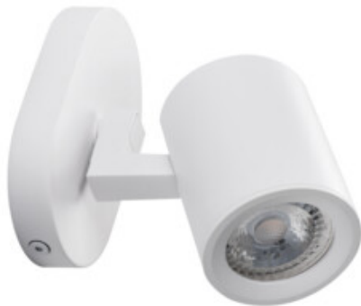
LAURIN EL-10 W