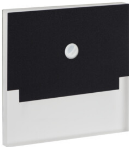
SABIK LED PIR B