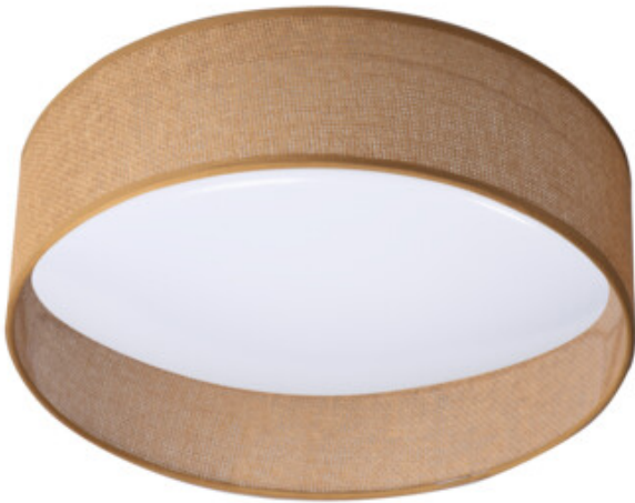
RIFA LED 17,5W N2