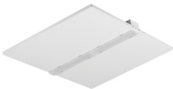
KND W P1