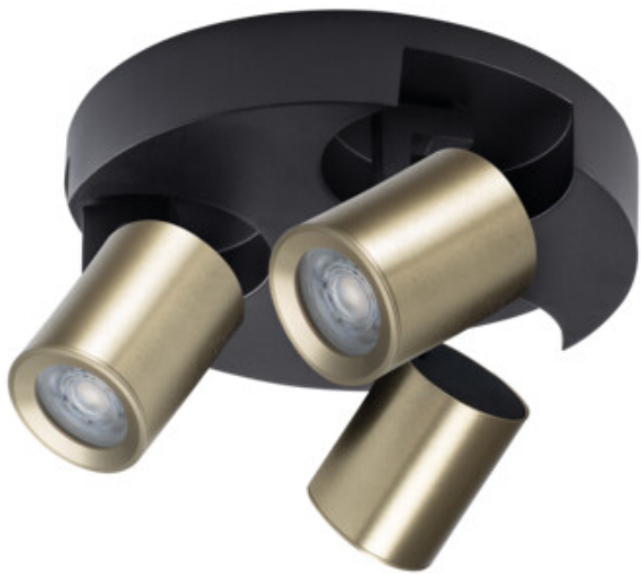
LAURIN EL-30 B-G