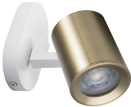
LAURIN EL-10 W-G