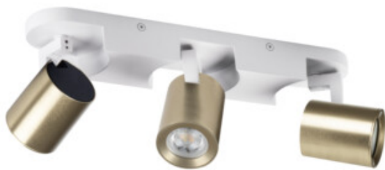
LAURIN EL-3I W-G