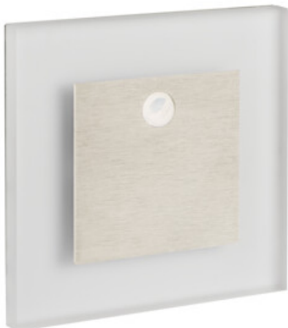
APUS LED AC