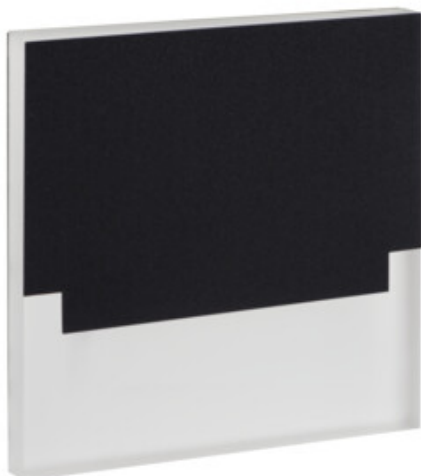
SABIK LED B; SABIK LED AC B