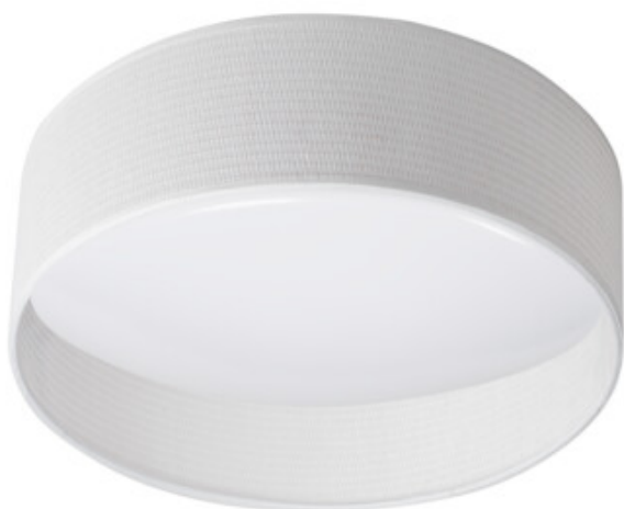
RIFA LED 17,5W N1