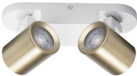
LAURIN EL-2I W-G