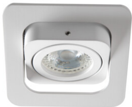
ALREN R DTL-W