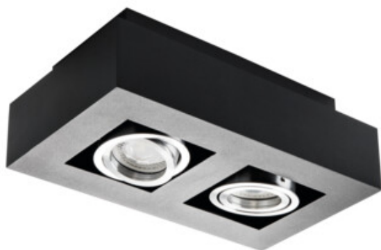
STOBI DLP 250-B