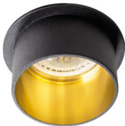
SPAG S B-G