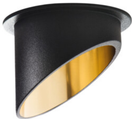
SPAG C B-G