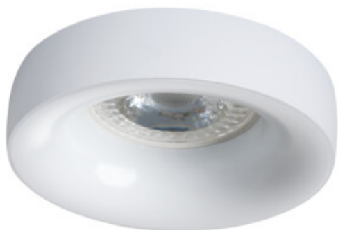
ELNIS L W