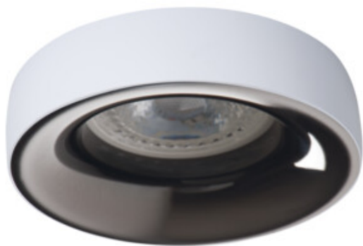
ELNIS L W/A