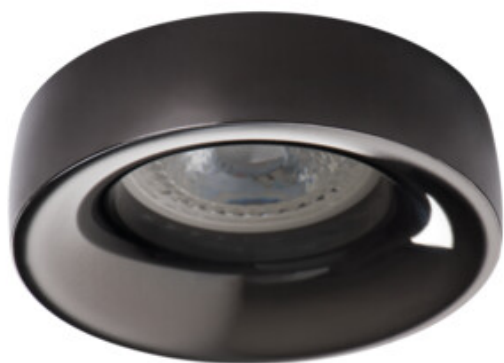
ELNIS L A