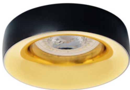
ELNIS L B/G