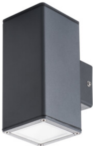
GORI EL 235 D