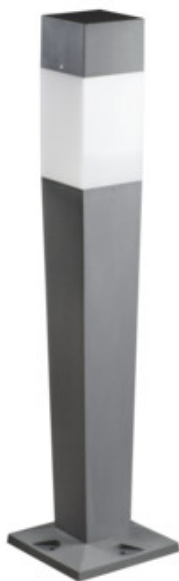
INVO OP 107-L-GR