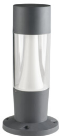
INVO TR 47-O-GR