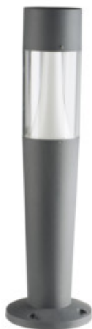
INVO TR 77-O-GR