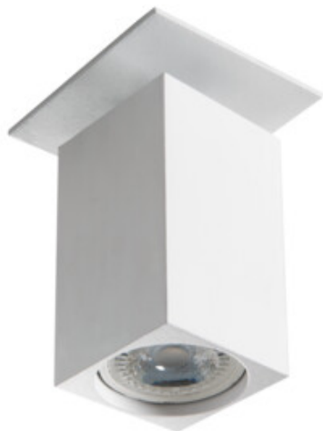
CHIRO GU10 DTL-W