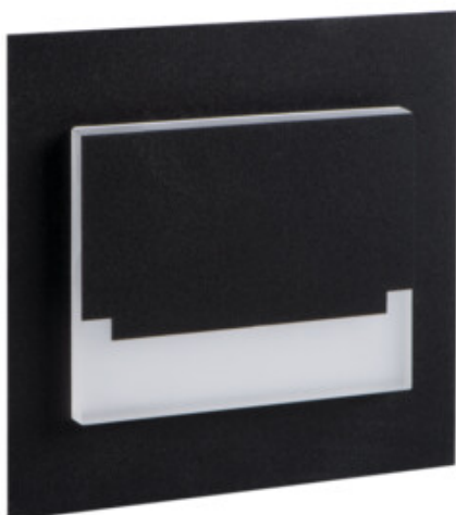
SABIK MINI LED B