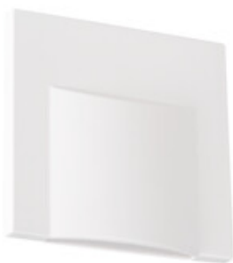
ERINUS LED L W