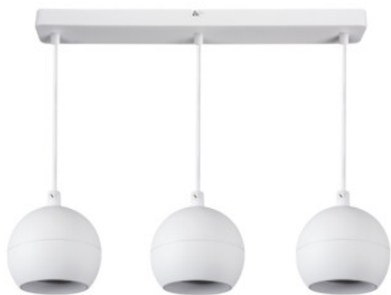
GALOBA C 1xGU10 W