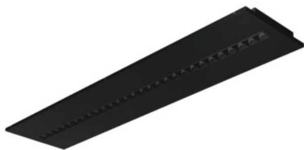
OS RST B P3