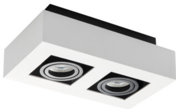
STOBI DLP 250-W