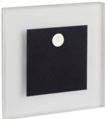
APUS LED PIR B