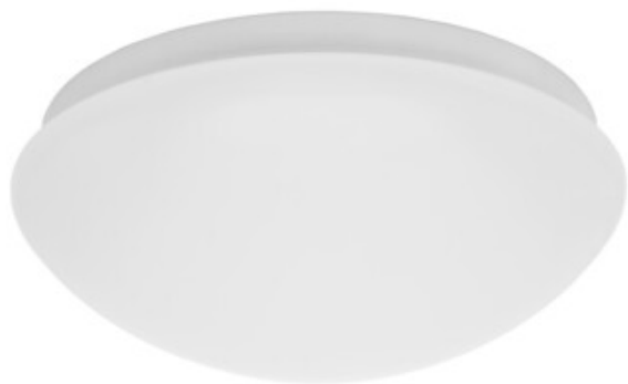
PIRES ECO DL-250