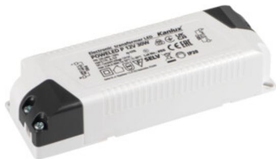
POWELED P 12V 30W