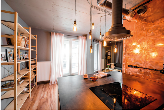
KANLUX S.A. (kat 26047) ST64 A 4W-SW / LDC (Polar)

Luminaire: KANLUX S.A. (kat 26047) ST64 A 4W-SW Lamps: 1 x ST64 A 4W-SW