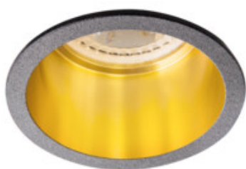
SPAG D B-G