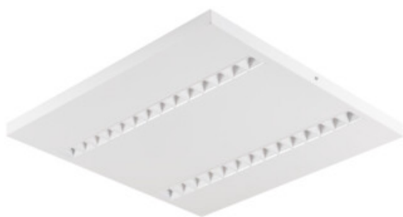
OS RST W N1