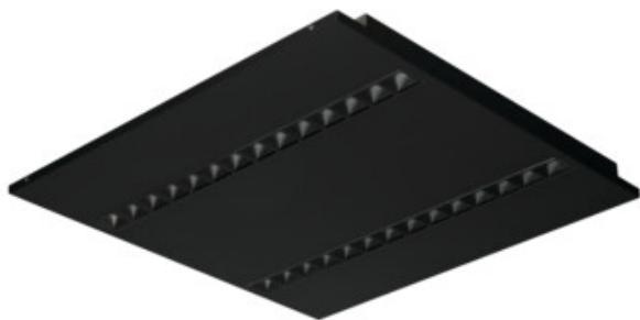
OS RST B P1