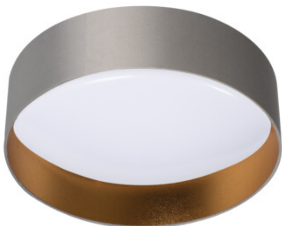
RIFA LED 17,5W GR/G