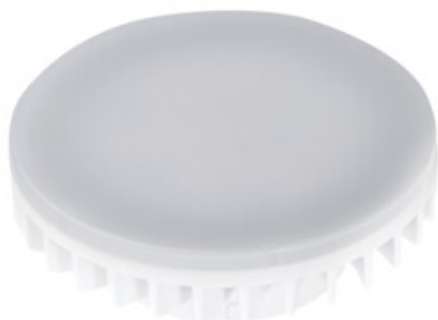
ESG LED 9W GX53