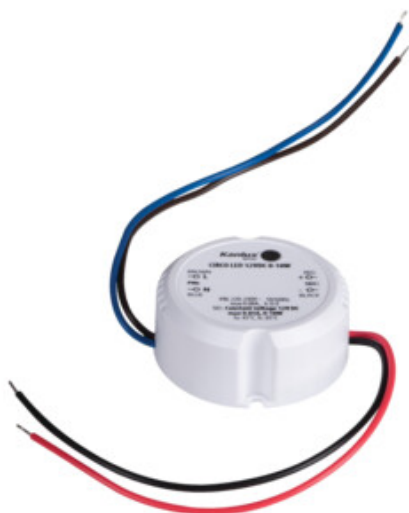
CIRCO LED 12VDC