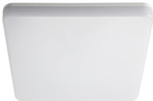
VARSO LED 24W-L; VARSO LED 24W-L-SE