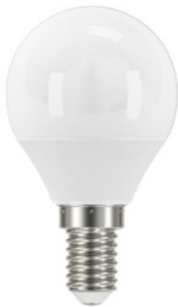
IQ-LED G45E14 5,5W