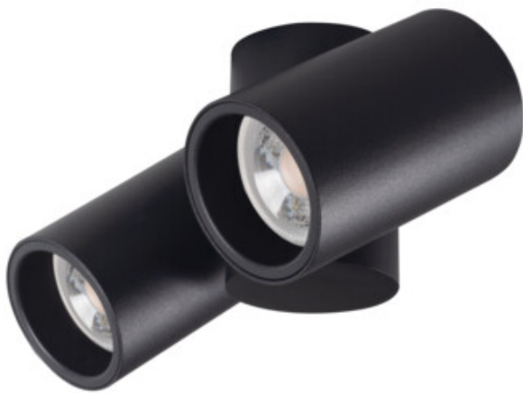
BLURRO GU10 CO-B