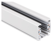
33232 TEAR N TR 2M-W

Komponent lištového systému, TEAR N TR 2M-W, 3-fázová lišta, bílá, (33232)