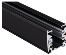
33232 TEAR N TR 2M-W