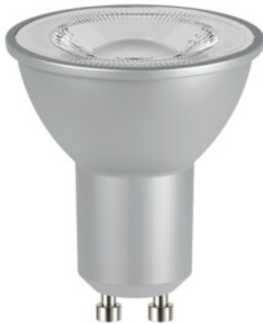
IQ-LED GU10 6,5W