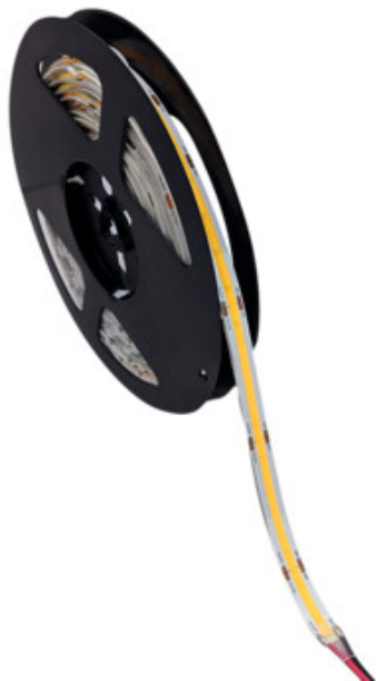
LCOB 10W-M 24