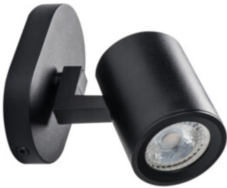
LAURIN EL-10 B