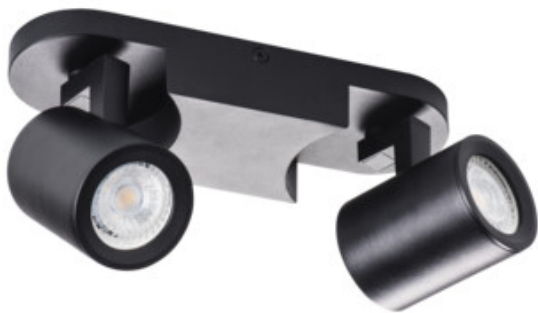
LAURIN EL-2I B